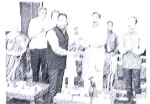
यवतमाल कॉलेजांनी येता आनी उमेदवार तुंके घेवें म्हायत करताना नवभार

यवतमाल जिल्हा कौशल विकास रोजगार आणि उद्योगिता भागदशोन केड के अंतर्गत डॉटेल करियर सेटर तथा उद्योग कौशल मैनैजमेंट एंड कंप्यूटर मास्टर के सम्बन्धित नवभारत में दिनांक 22 जुलाई को डॉटेल दीनदयाल उपाध्याय रोजगार सम्मेलन का आयोजन किया गया है। यह कार्यक्रम जाजू महाविद्यालय नारीग नगर के पीछे यवतमाल में आयोजित किया जाएगा इस मेल के लिए 450 रिक्त पदों को अधिसूचना प्राप्त हुई है। इस रोजगार मेले में एक के.एम.टी. विभाग प्रा. लि. तेलंगाना, बैंक नवीकल प्रा. लि., यवतमाल, डिस्टील एजुकेशन एंड टेक्नोलॉजी प्रा. लि., छत्रपती संभाजीनगर व पुणे ट वॉल बैंकर्स, यवतमाल, ब्रह्मा डेअरी, यवतमाल सहयोग मस्टरसेट क्रेडिट को-ऑप सोसायटी, यवतमाल, आर के इंग्लिश मीडियम स्कूल, दिगम, मेगाफोड बायोटेक, नागपुर विनय टीवीएम, यवतमाल, एसबीआई लाइफ इन्शरन्स, यवतमाल, साय स्पिटेक्स प्रा लि, यवतमाल, एमड यूको डीनय प्रा लि, यवतमाल, आर्बेन को-ऑपरेटिव बैंक लि, यवतमाल आदि कंपनियों और उद्योगों हिस्सा लेगे। उम्मीदवार्ता में अनुरोध है कि वे कौशल, रोजगार, उद्योगिता और नवाचार विभाग को अभिकृत वेबसाइटों rojgar mahaswayam.gov.in तथा cmshpy.mahaswayam.gov.in पर ऑनलाइन आवेदन करें, तथा 22 जुलाई को जाजू कॉलेज ऑफ मैनेजमेंट एंड कंप्यूटर साइंस, नारीग नगर के पीछे, धामणगाव रोड, यवतमाल में स्वयं के खर्च पर साक्षात्कार के लिए उपस्थित रहें।