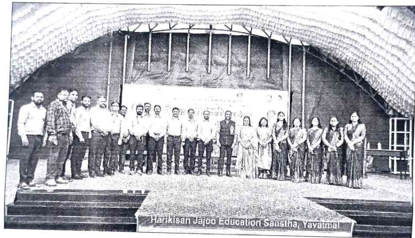
Pic: Organizing Committee Members