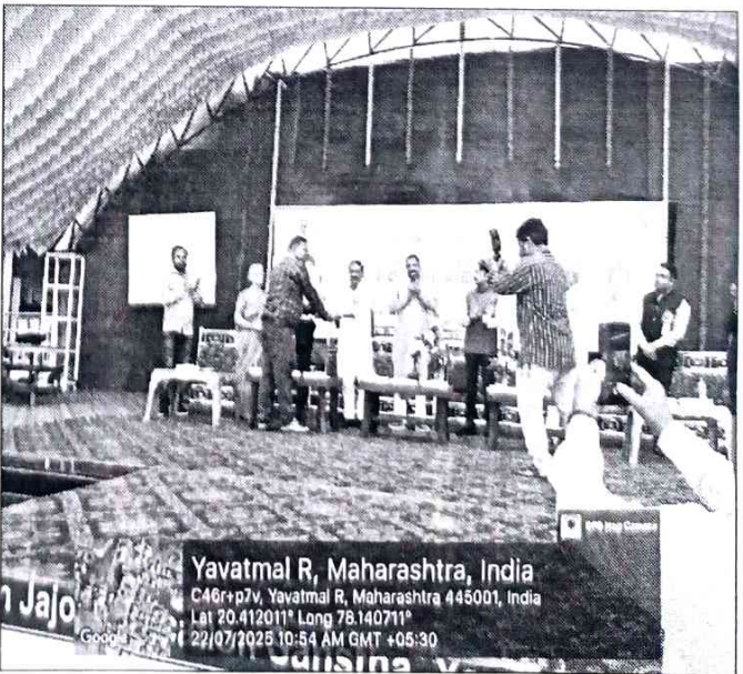
Pic: Guest Felicitation by Organizing Committee Members